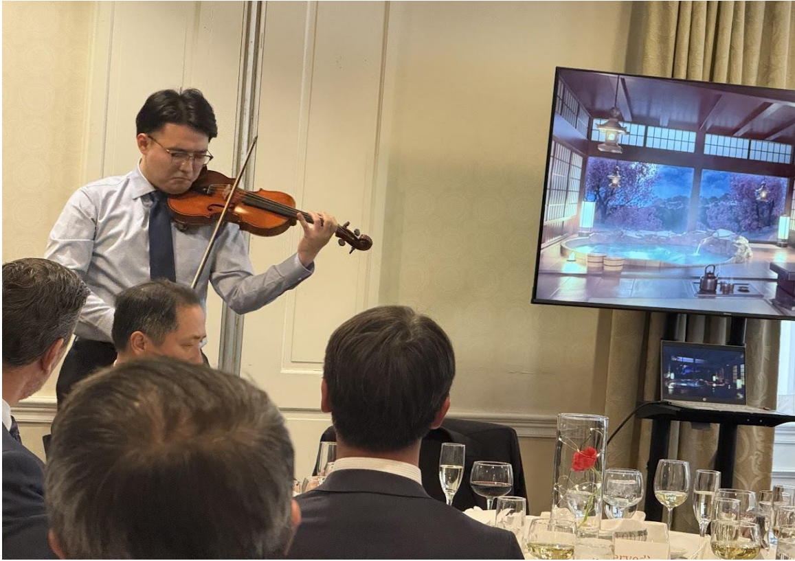
TBS 樫元ワシントン支局長によるご講演